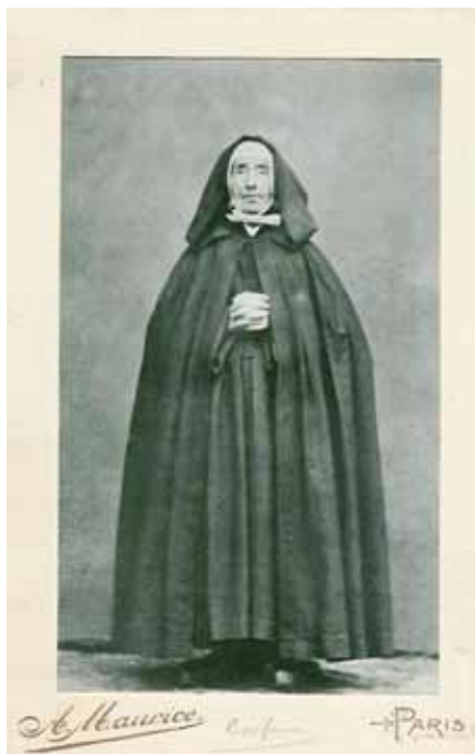
Dobová fotografie Jeanne Juganové

V dnešním evangeliu, v blahoslavenstvích, nám Ježíš připomíná, že všechny naše skutky, které konáme ve prospěch druhých, mají duchovní rozměr. My se podílíme na novém stvoření. Jsme svědky toho, jak je Boží království přítomné