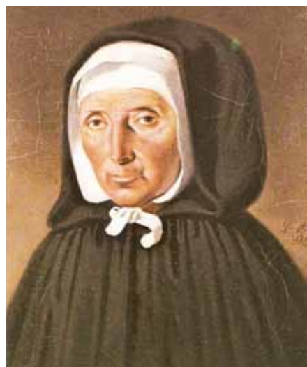
Svatá Marie od Kříže (Jeanne Jugan)

Promluva washingtonského arcibiskupa ke kanonizaci zakladatelky Marie de la Croix