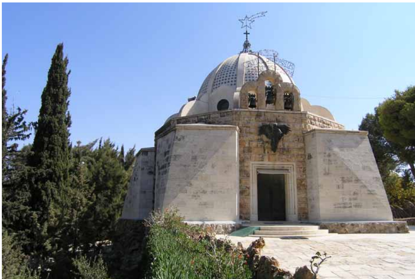
Katolická františkánská kaple Pole pastýřů z roku 1954 na betlémském předměstí