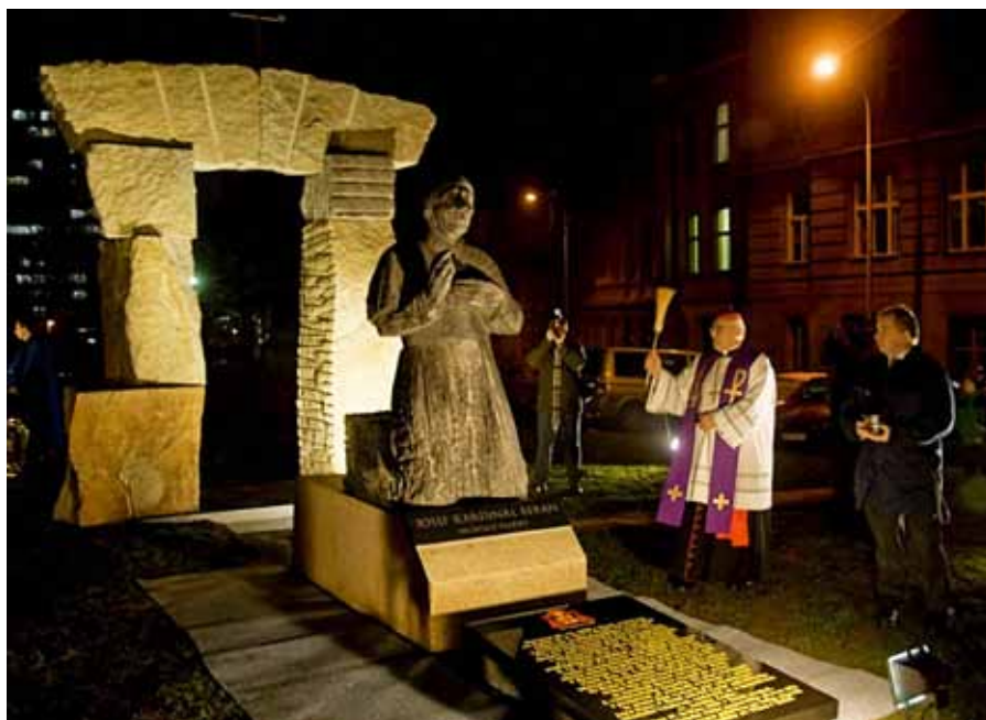
Kardinál Miloslav Vlk žehná pomník kardinála Josefa Berana před Arcibiskupským seminářem v Praze-Dejvicích 7. prosince

Já hlasuji pro zákaz komunistické ideologie. Ne z osobní nenávisti ke komunistům, že mě v minulosti tvrdě poškozovali a pronásledovali – to jsem jim jako křesťan už dávno odpustil – ale proto, že jejich ideologie škodí i dnes přímo nebo nepřímo této společnosti, i když už nemá takovou politickou moc.