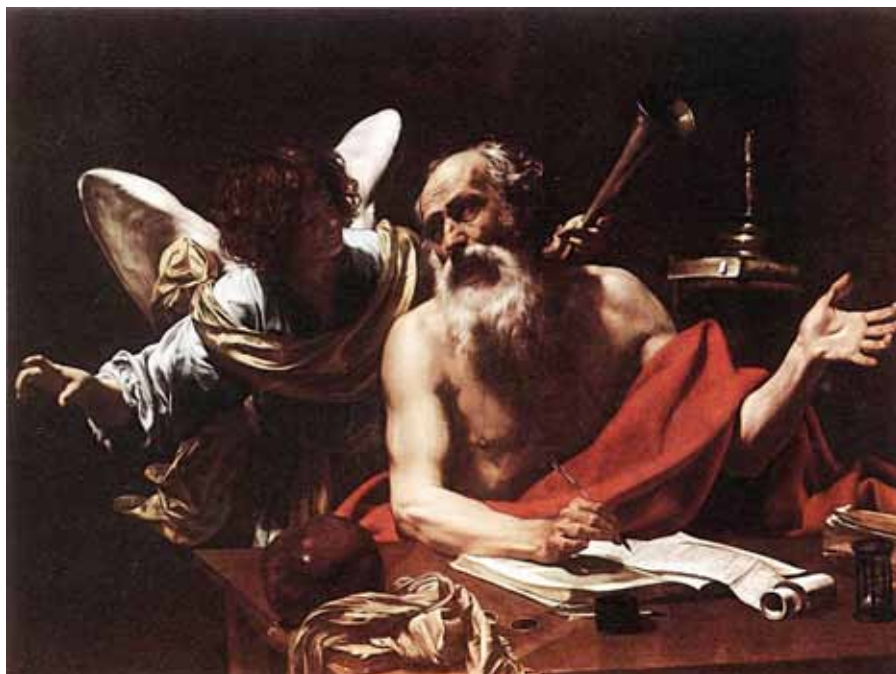
Simon Vouet: Svatý Jeroným a anděl (20. léta 17. stol.)

Benedikt XVI. ke členům Mezinárodní teologické komise