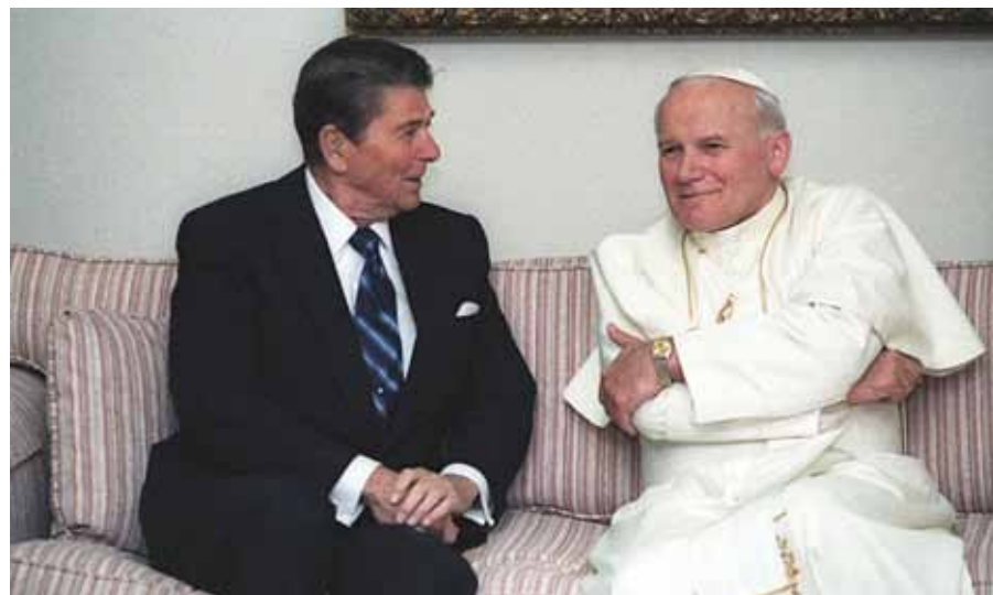
Setkání prezidenta USA Ronalda Reagana s papežem Janem Pavlem II. ve Fairbanksu na Aljašce v roce 1984

...nemůžeme pochybovat o vlivu Jana Pavla II., který daleko přesahoval jakoukoli sekulární postavu své vlasti a rozšířil své působení i do dalších zemí. To on byl katalyzátorem sil, jež se začaly vynořovat už na počátku osmdesátých let.