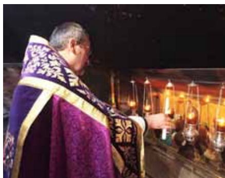
Kustod Svaté země P. Pierbattista Pizzaballa OFM zapaluje svíci v betlémské jeskyni Narození