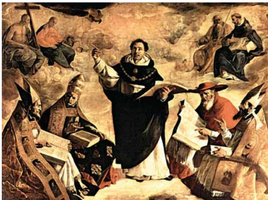
Francisco de Zurbarán, Apošteza sv. Tomáše Akvinského (1631).

I smrt a trýzeň a tisícera muka mu byly jakoby dětskou hrou, jen když mohl něco vytrpět pro Krista.