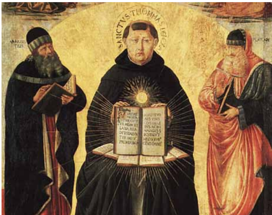
Učitelé dialogu Aristoteles, Platón a svatý Tomáš Akvinský Benozzo Gozzoli, Sláva svatého Tomáše, detail (1485).