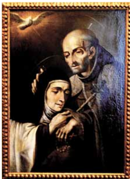
Melchor Pérez de Holguín, Sv. Petr z Alcantary se sv. Terezií z Avily (1701)